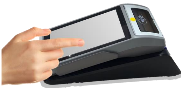
【チケット引換券の発券用端末】

チケットカウンターなど、対面でチケットを販売する際にご利用いただける発券端末です。購入したチケット情報が含まれるレシートを印字します。お客さまはレシートの情報からスマートフォンでチケットを受け取ることができます。