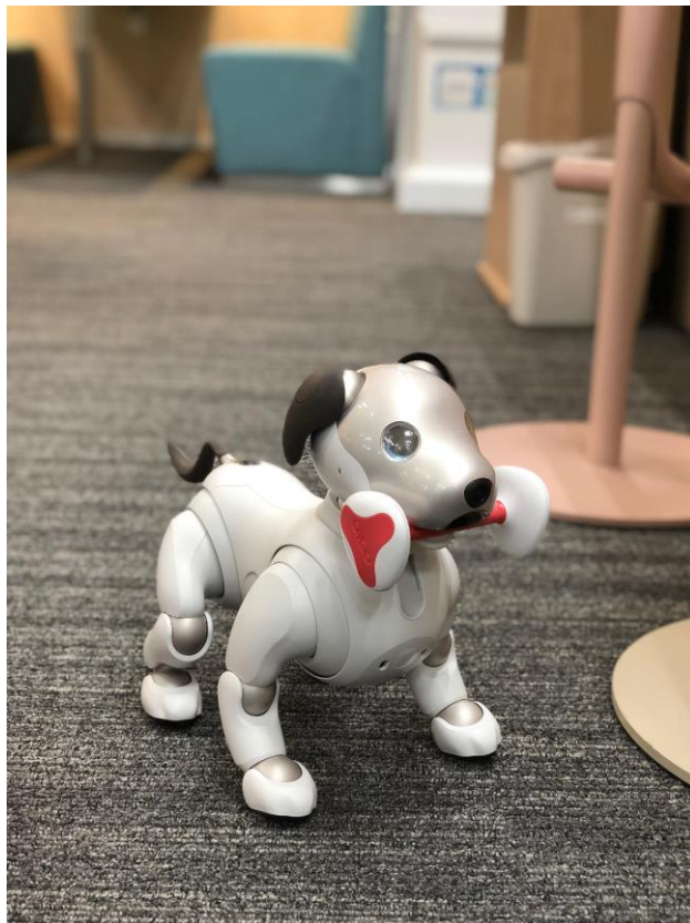
aibo が社員に癒しを運ぶ